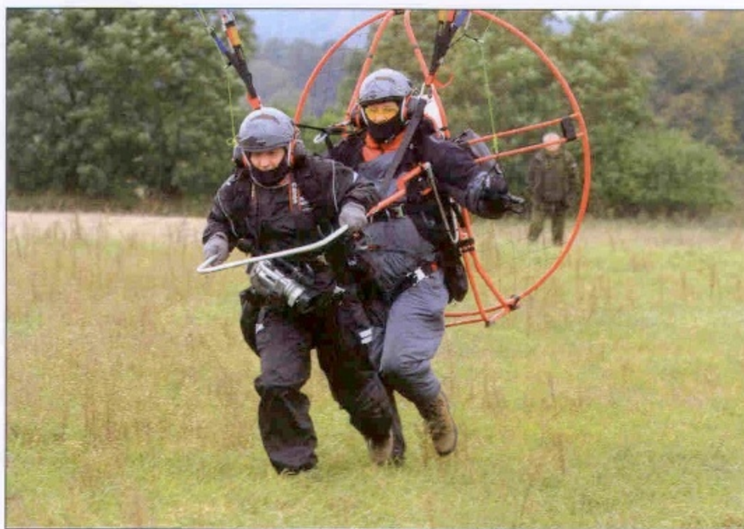
Ekipa filmowa startuje do zdjęć z parolotni.

Zmiana modelu lasu i leśnictwa w Polsce z biegiem lat zaczęła eksponować nie tylko jego głów-