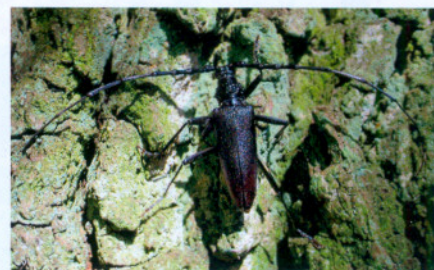
Kozioróg dębosz – Rogalin

Opolszczyźnie. Gatunek ten jest mniej wymagający niż dąb szypułkowy, dlatego spotkać go można na glebach mniej żyznych. Jednocześnie na glebach uboższych rośnie on w towarzystwie sosny i brzozy.