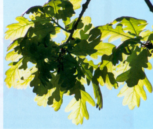
Młode liście dębu