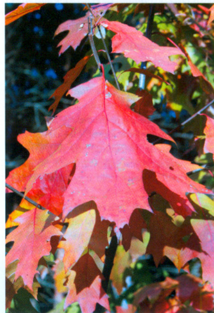
Dąb czerwony – przebarwione liście