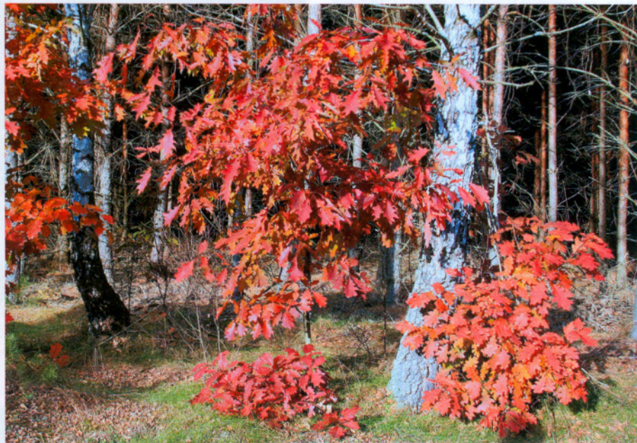
Dąb czerwony – wchodzenie do drzewostanów

W leśnej powierzchni Polski gatunki drzew liściastych stanowią aktualnie 27,8%, a udział dębu jest najwyższy i wynosi 7,3%. Kolejne miejsca pod względem udziału zajmują: buk (5,5%) i olcha (4,7%).