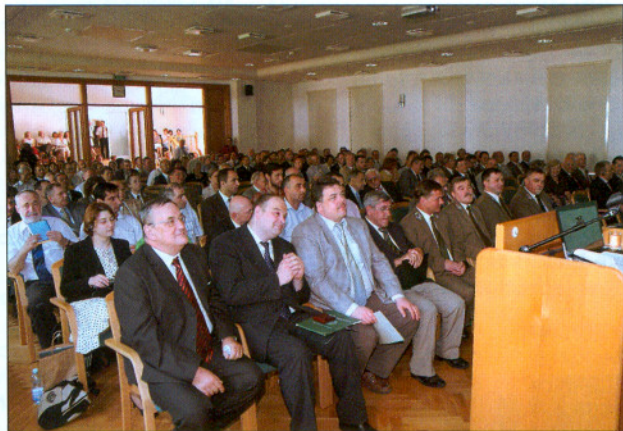
Uroczystość jubileuszu 80-lecia Instytutu Badawczego Leśnictwa była świętem dla szerokiego grona naukowców, praktyków, nestorów oraz zaproszonych gości.

D o nestorów wśród placówek naukowych w Polsce należą Instytut Meteorologii i Gospodarki Wodnej, który został utworzony w 1972 roku w wyniku połączenia Instytutu Hydrologiczno-Meteorologicznego z Instytutem Gospodarki Wodnej, oraz Państwowy Instytut Geologiczny. Warto podkreślić, że oba te Instytuty powołano do życia w 1919 r. – już w pierwszym roku po uzyskaniu przez nasz kraj niepodległości po 123 latach niewoli.